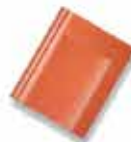
အုတ်ကျိုးရောင်