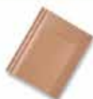
ကျောက်ညိုရောင်