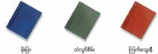
မိုးဖြာ သံလွင်စိမ်း ကြက်သွေးနီ