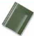
စစ်စိမ်း