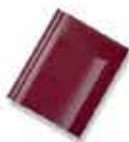
ကြက်သွေးရင့်