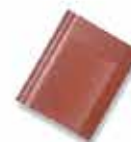
အညိုရောင်