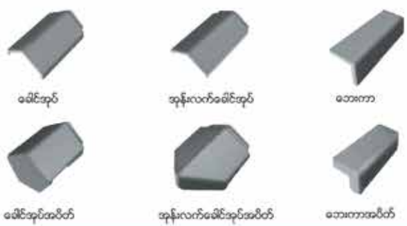
ခေါင်းအုပ် အုန်းလက်ခေါင်းအုပ် သောကာ ခေါင်းအုပ်အပိတ် အုန်းလက်ခေါင်းအုပ်အပိတ် သောကာအပိတ်