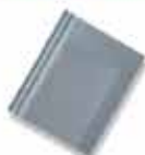
ခဲကျောက်ရောင်