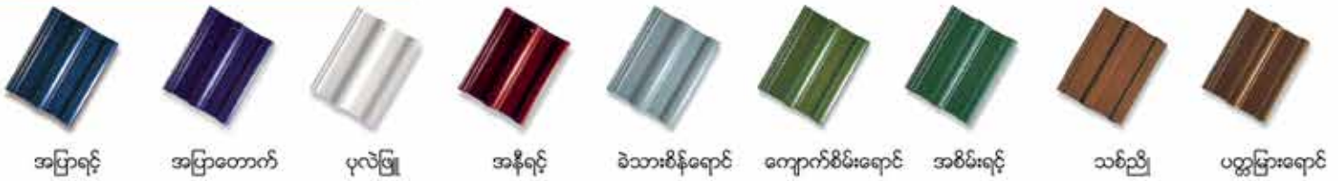
အပြာရင့် အပြာတောက် ပုလဲဖြူ အနီရင့် ခဲသားစိန်ရောင် ကျောက်စိမ်းရောင် အစိမ်းရင့် သစ်ညို ပတ္တမြားရောင်