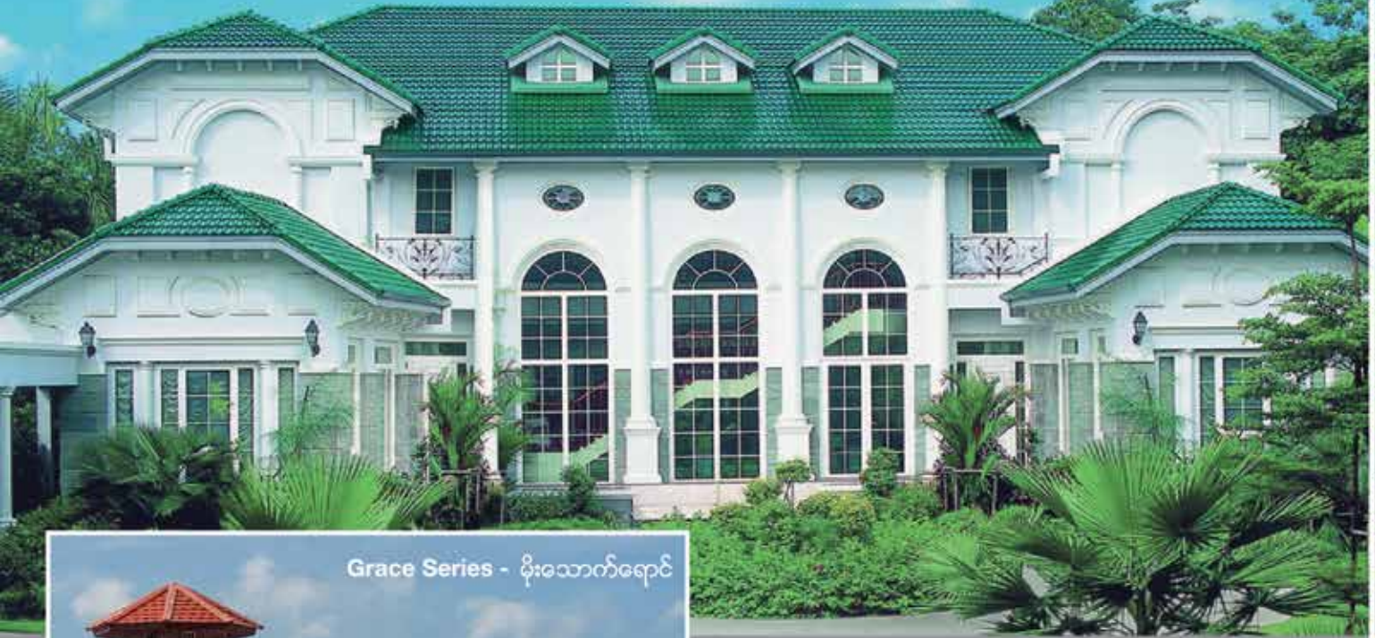
Grace Series - မိုးသောက်ရောင်