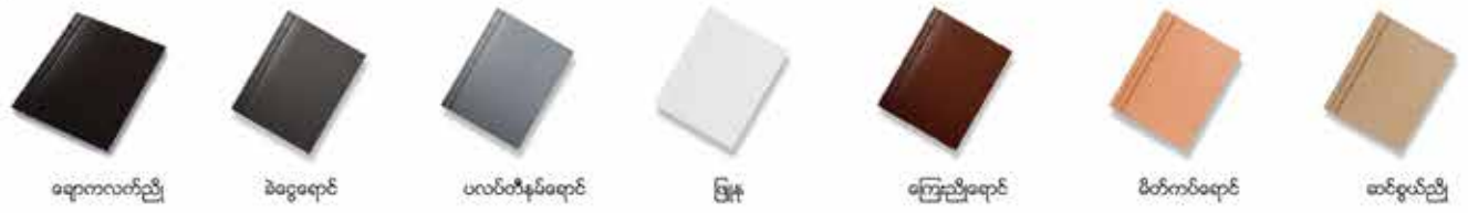
မေ့ကလက်ညှိ ခဲဝေ့ရောင် ပယ်တီနပ်ရောင် ဖြူ ကြေးညိုရောင် မိတ်ကပ်ရောင် ဆင်စွယ်ညို