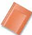
ရွှံ့စေးရောင်