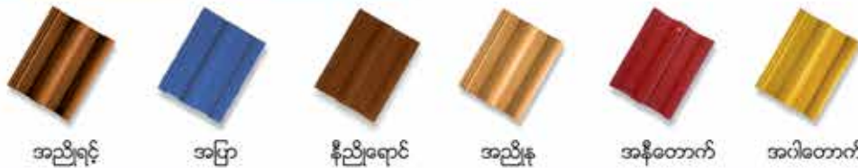
အညိုရင့် အပြာ နီညိုရောင် အညိုနု အနီတောက် အဝါတောက်